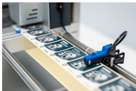
snímač etikiet na aplikátore Herma eco